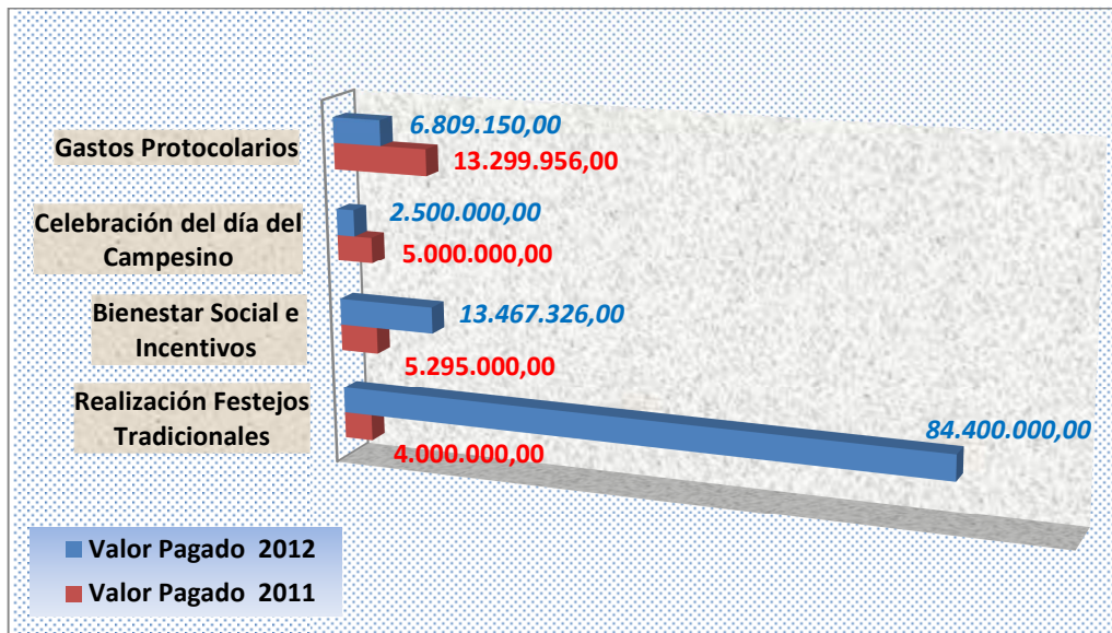
Ilustración 1. Rubros de Mayor Incremento

Los rubros que contribuyeron en mayor porcentaje a esta cifra fueron los correspondientes a Realización Festejos Tradicionales con un incremento equivalente al 2010,00%, teniendo en cuenta que por medio de este rubro se ejecutaron actividades de las tradicionales festividades municipal y departamental del arroz, seguido por el rubro de Bienestar Social e Incentivos a Empleados presentó un incremento del 154,3%, justificado en la ejecución de los diferentes programas de desarrollo de talento humano establecidos por la entidad, el rubro de Celebración del Día del Campesino con un incremento del 100% y por último el rubro de Gastos Protocolarios con un incremento del 95,3%.